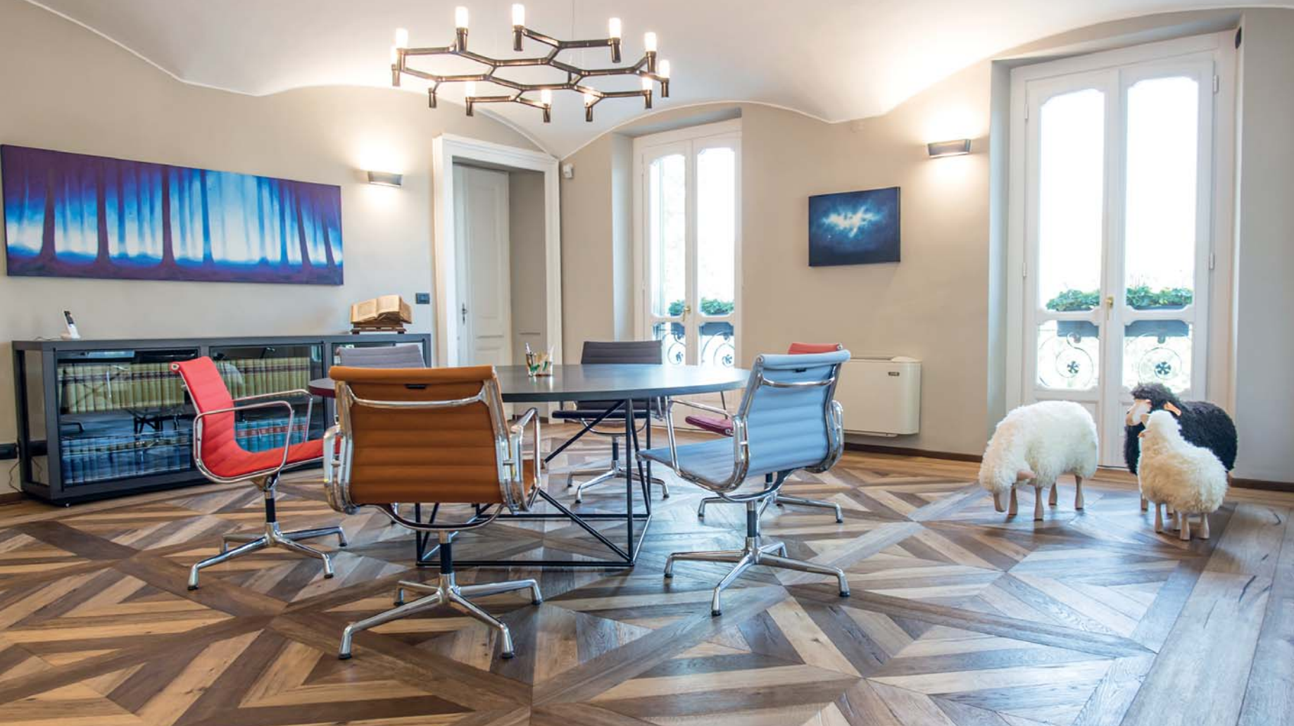
Sala riunioni con Table de Conférence di Le Corbusier, Aluminium Chair di Charles Eames e Sheeps di Hanns-Peter Krafft in vera lana di pecora e gambe in legno di faggio